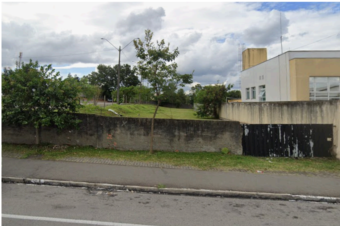
Figura 03 – Terreno onde será implantada a edificação - Vista a partir da Rua Europa