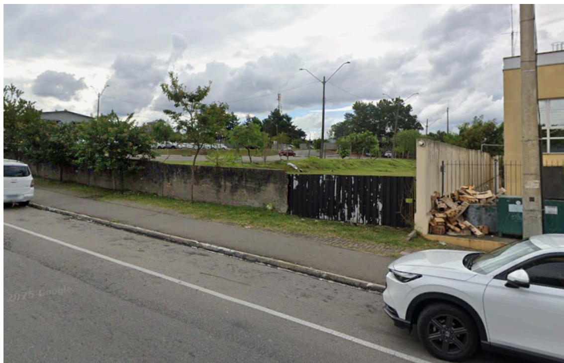
Figura 04 – Terreno onde será implantada a edificação - Vista a partir da Rua Europa