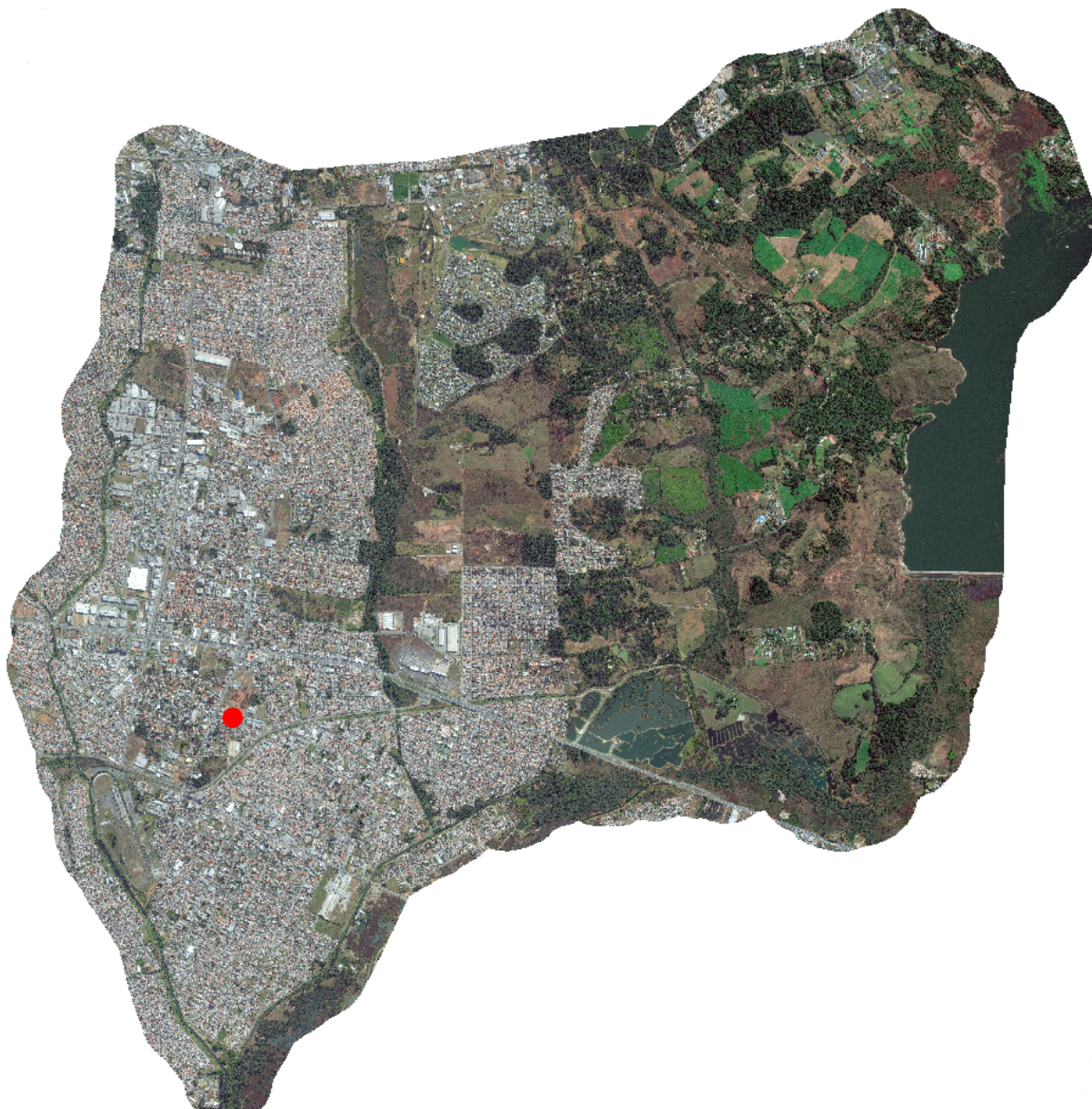
Figura 01 – Mapa de Pinhais com a localização do lote.