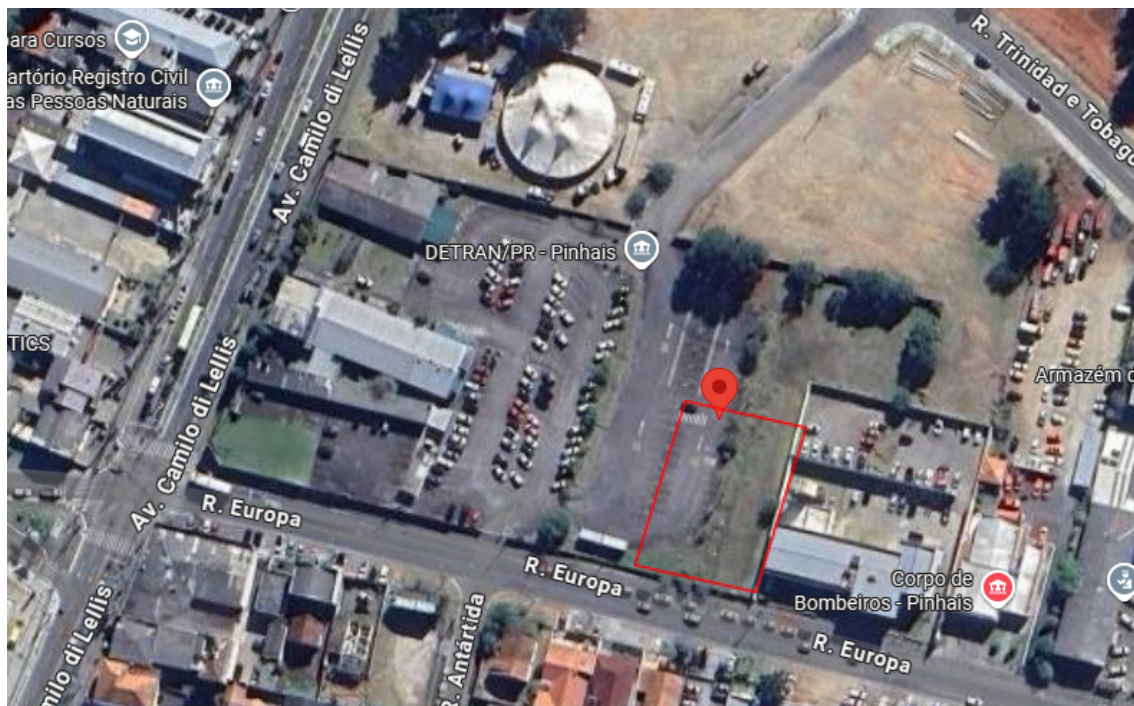
Figura 02 – Localização do lote.

No projeto desenvolvido, apresenta-se a localização do empreendimento com maior precisão, bem como seus limites e a conformação altimétrica.