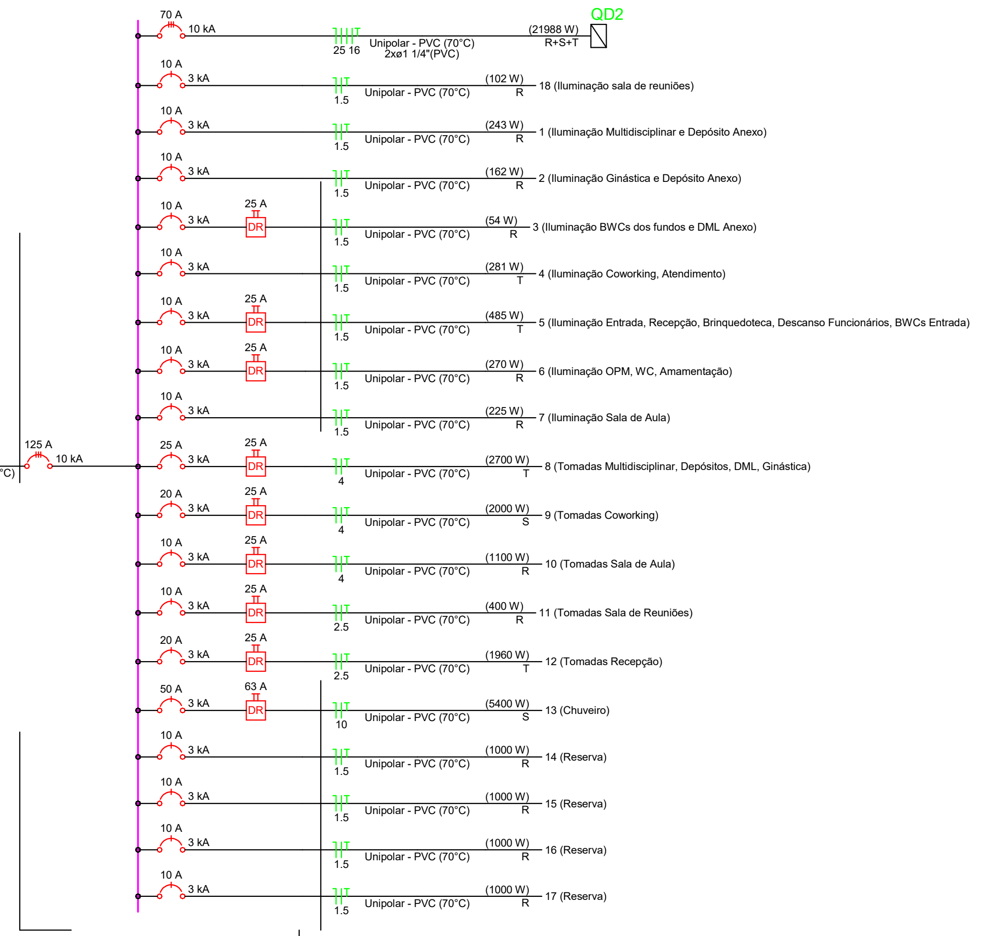
Diagrama Unifilar QD1 (sem escala)