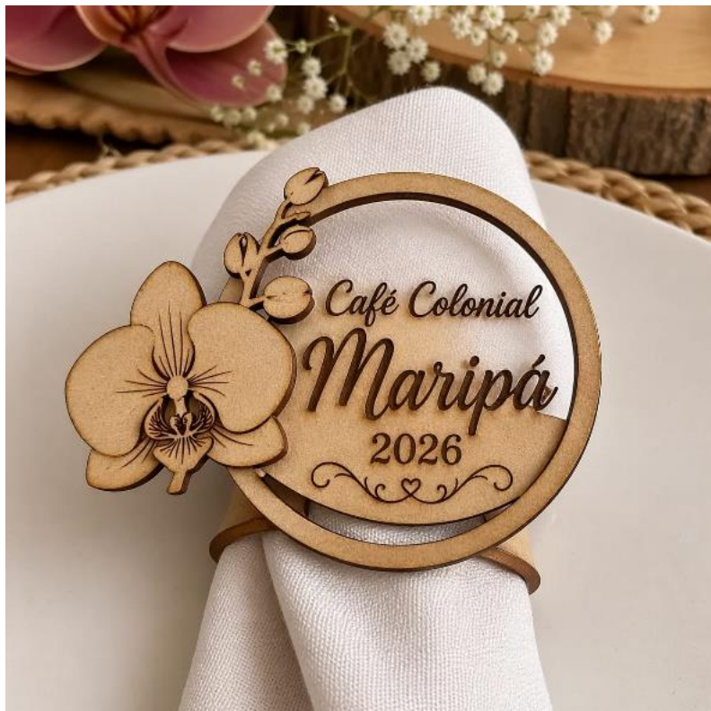
L – Item decorativo para mesas