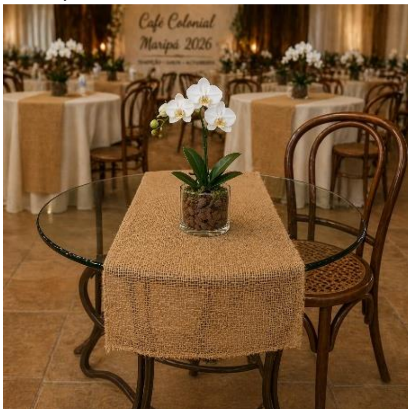
G – Hall de entrada