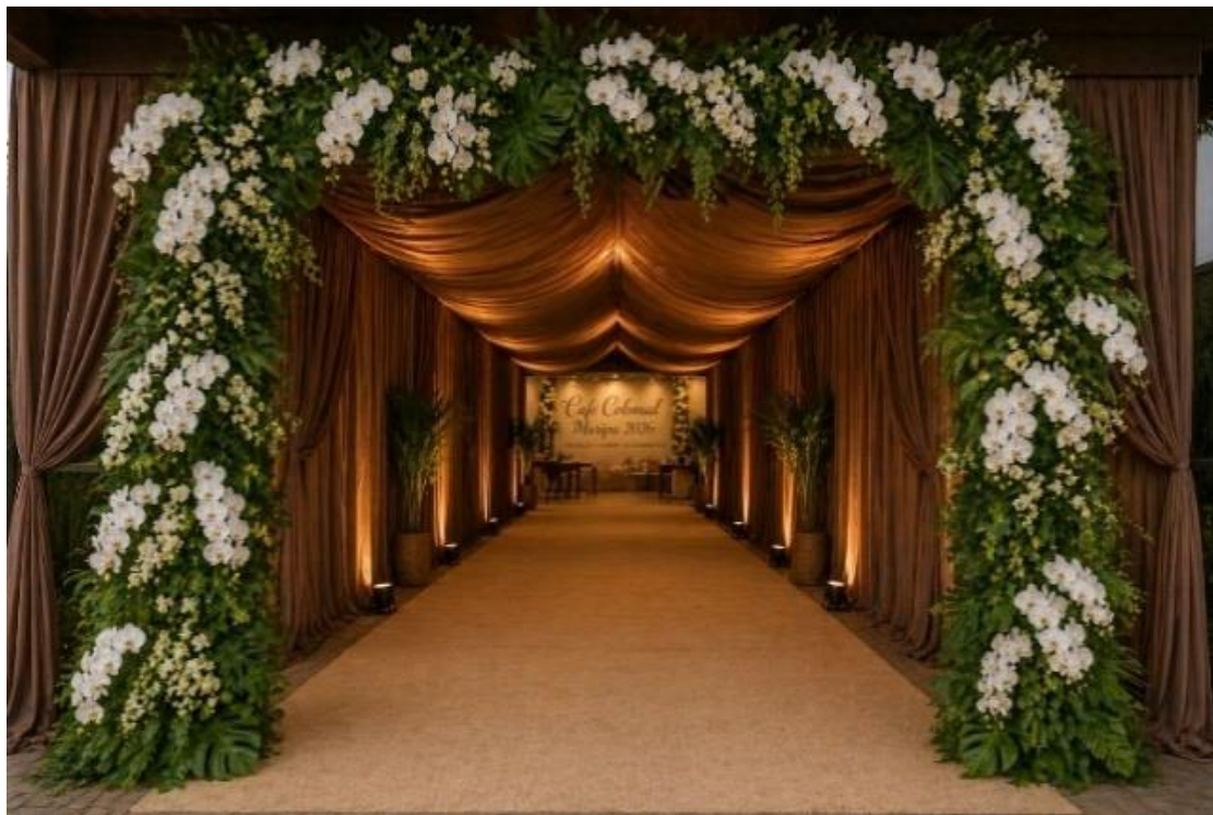
H – Painel decorativo cenográfico