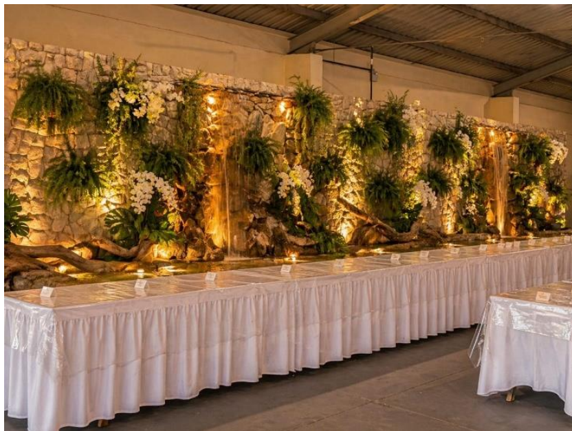
F – Mesas jurados