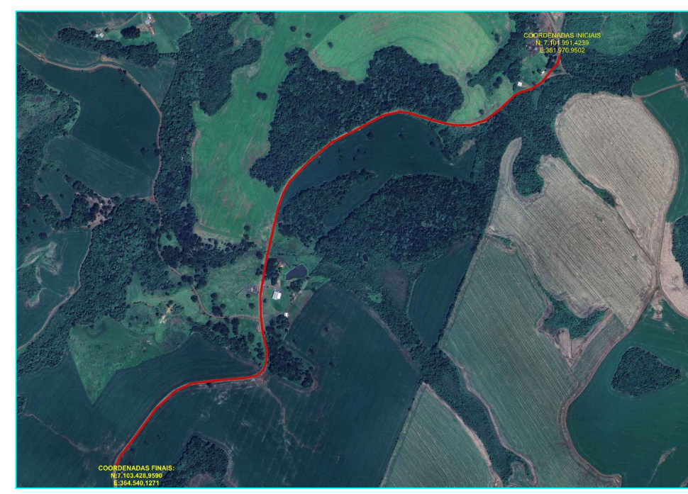
SITUAÇÃO 8 / 8