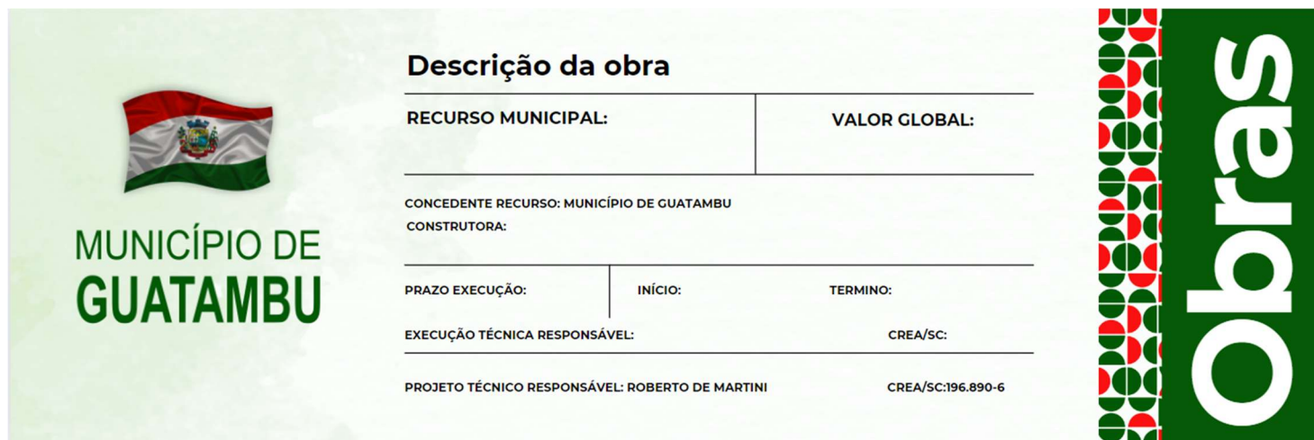
Figura 1 - Modelo de placa padrão prefeitura municipal de Guatambu

A CONTRATADA deverá fornecer e instalar placa indicativa de obra, respeitando rigorosamente as referências cromáticas, escritas, proporções, medidas e demais orientações convencionais.