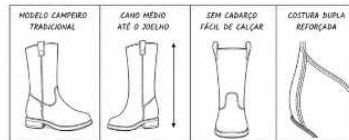
TABELA DE TAMANHOS