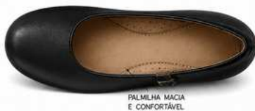
PALMILHA MACIA E CONFORTÁVEL