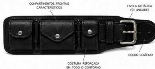
COMPARTIMENTOS FRONTAIS CARACTERÍSTICOS