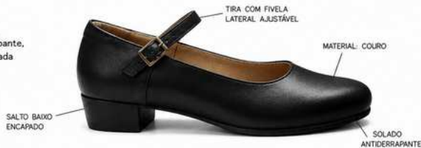
TIRA COM FIVELA LATERAL AJUSTÁVEL