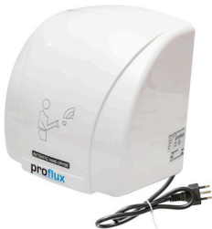
Secador de Mãos em Plástico ABS Branco PROFLUX 110V (51337)

Em estoque! Preço por quantidade: clique aqui