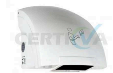
Secador de Mãos Branco Automático em ABS S106 220V - Ref. CR-100

Em estoque! Preço por quantidade: clique aqui