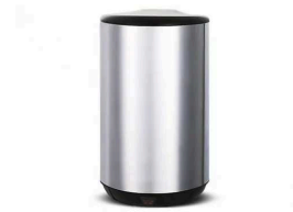
Secador de Mãos em Aço Inox Polido S401 - 220V Ref. CS106

Em estoque! Preço por quantidade: clique aqui