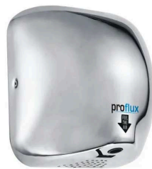
Secador de Mãos em Aço Inox 220V PROFLUX (51333)

Em estoque! Preço por quantidade: clique aqui