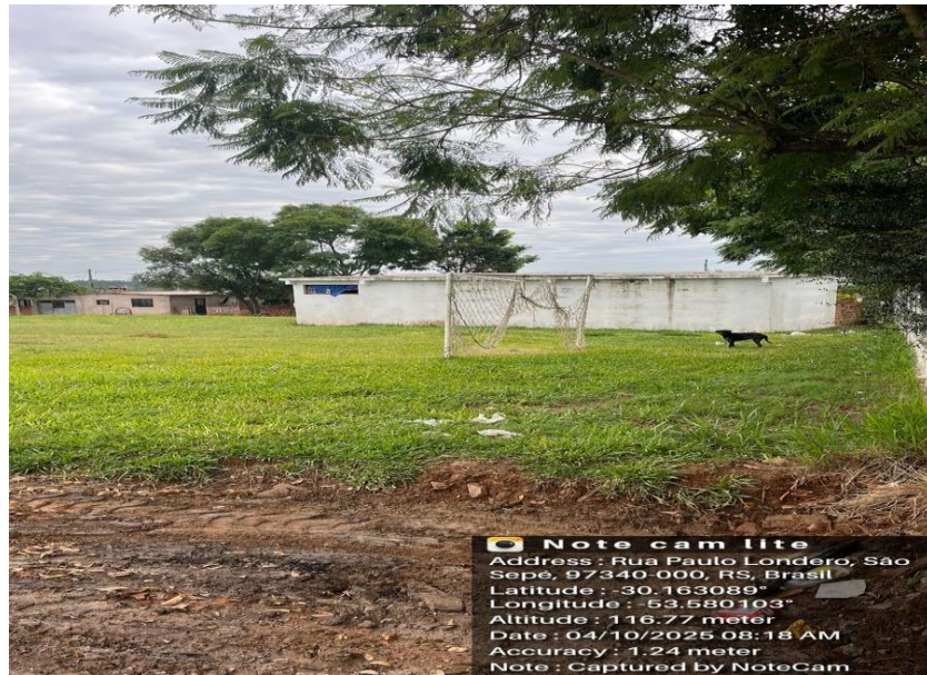
Vista Área Construção Sentido Oeste-Leste