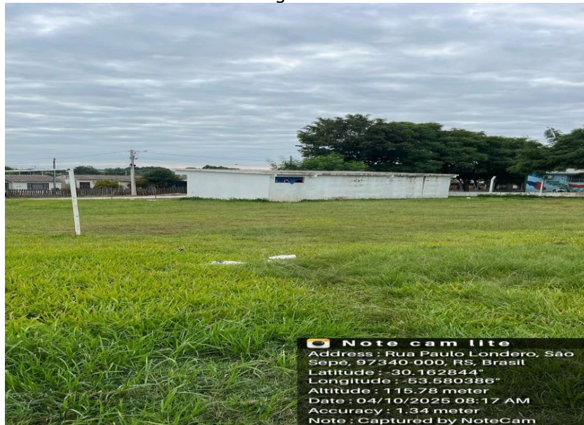
Vista Área Construção Sentido Noroeste-Sudeste