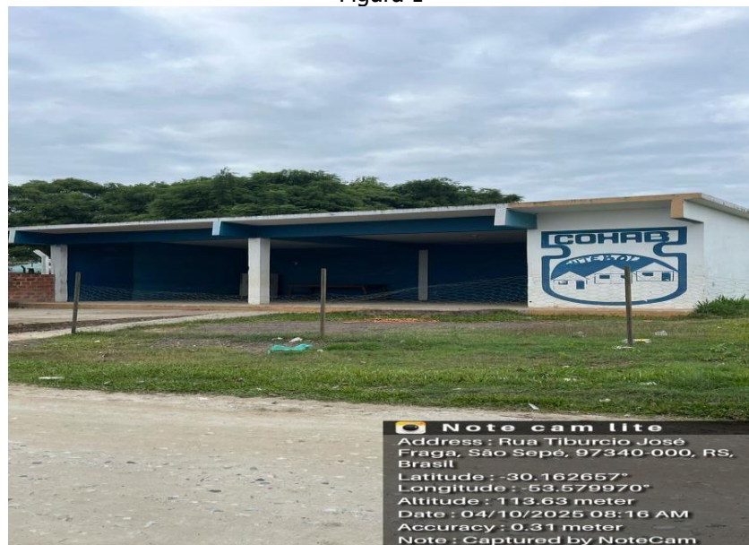
Vista Frontal Imóvel Sentido Leste-Oeste