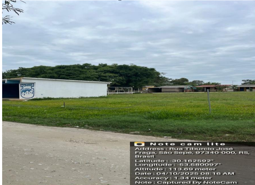
Vista Área Construção Sentido Norte-Sul